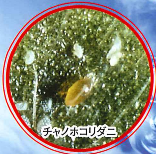
チャノホコリダニ