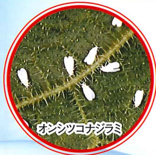
オンシツコナジラミ